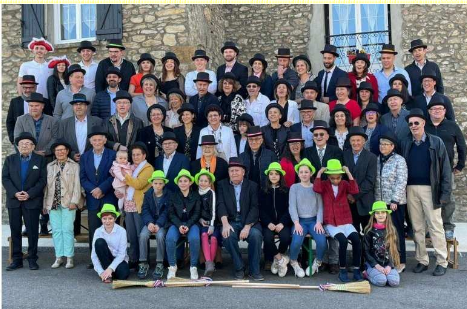
Photo de groupe des classes en 1 et 2 en 2022

A Saint-Genis-l'Argentière, la fête des classes continue à être organisée et permet une belle fête au village.